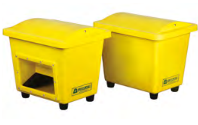
SBA 110 mit/ohne Entnahmeöffnung

Sie sind aus GFK gefertigt, der gegen mechanische, wetterbedingte und chemische Einflüsse beständig ist (einfache Graffiti-Entfernung). Auf Kundenwunsch laminieren wir farbige Logos, Beschriftungen, Nummern etc. in die Oberfläche des Streugutbehälters. 5 Jahre Garantiezeit.