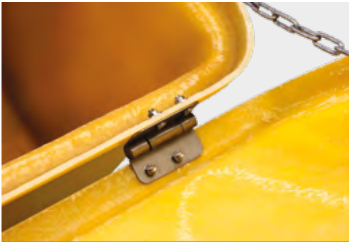
Scharnierdetail aus Edelstahl